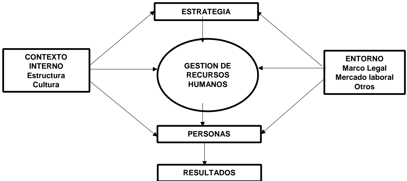
Figura N° 1. Modelo Integrado de Gestión Estratégica del Recurso Humano adaptado de Serlavós, tomado de: (Longo, 2002 pág. 11)